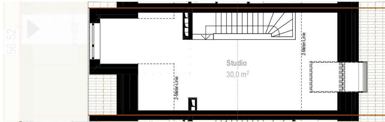
Grundriss DG Haus 2 (Standard) M1_100