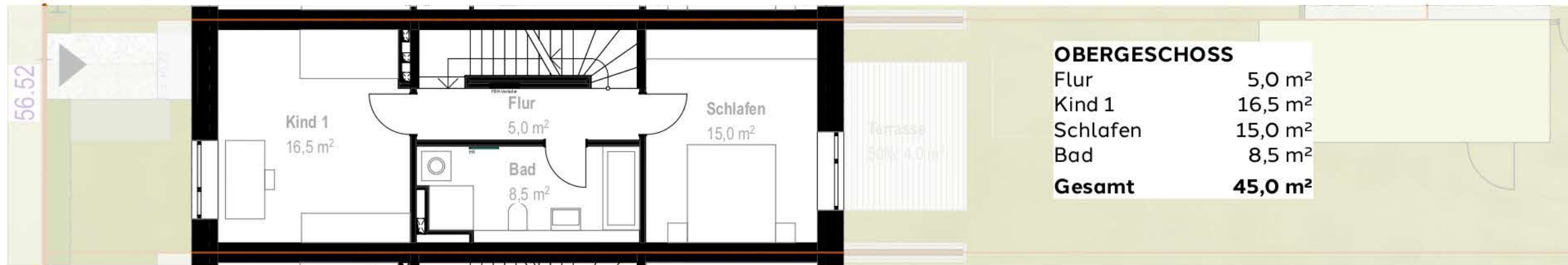
Grundriss OG Haus 2 M1_100